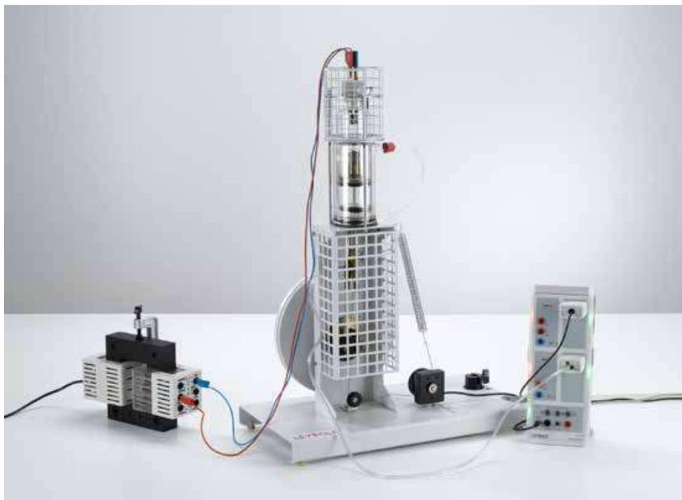
El motor de aire caliente como máquina térmica: Registro y evaluación del diagrama pV con CASSY (P2.6.2.4)

El motor de aire caliente como máquina térmica: Registro y evaluación del diagrama pV con CASSY